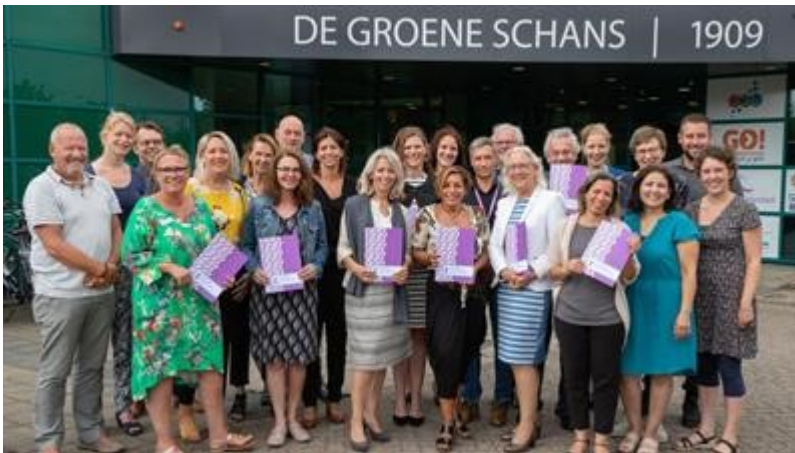
Ondertekening convenant informele zorg 2019