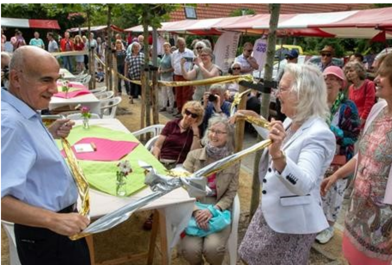
Opening vernieuwd Zenithplein 2019

In 2018 heeft onderzoeksbureau Movisie Mensen Maken de Buurt geëvalueerd. De aanbevelingen uit het rapport zijn overgenomen: de samenwerking met het opbouwwerk is verstevigd en de richtlijnen voor het toekennen van budget zijn in overleg met de uitvoering aangescherpt.