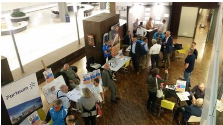
Motiemarkt, september 2019