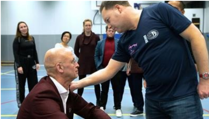
Start weerbaarheidsproject 'Overal jezelf kunnen zijn' 2019

De gemeente stelt voor 2020 voor de uitvoering van het LHBTI+ beleid een bedrag van € 45.000,- beschikbaar (€ 25.000,- regulier plus € 20.000,- voor vier jaar gedekt door een rijksuitkering).