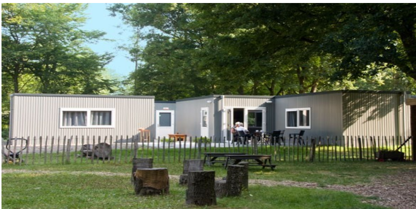
Respijthuis op de stadscamping

Met het Respijthuis is afgesproken dat zij zich in zullen spannen om de bezetting van het Respijthuis in de komende tijd te vergroten.