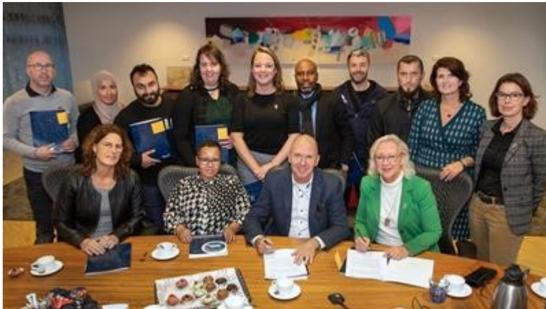
Ondertekening overeenkomsten huishoudelijke ondersteuning 2019