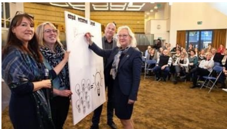
Ondertekening convenant Eenzaamheid 2018

Inmiddels zijn verschillende werkgroepen actief om aanpak en activiteiten te ontwikkelen, het taboe rond dit thema te doorbreken en het onderwerp onder de aandacht te brengen. In bijlage 5 is dit verder uitgewerkt.