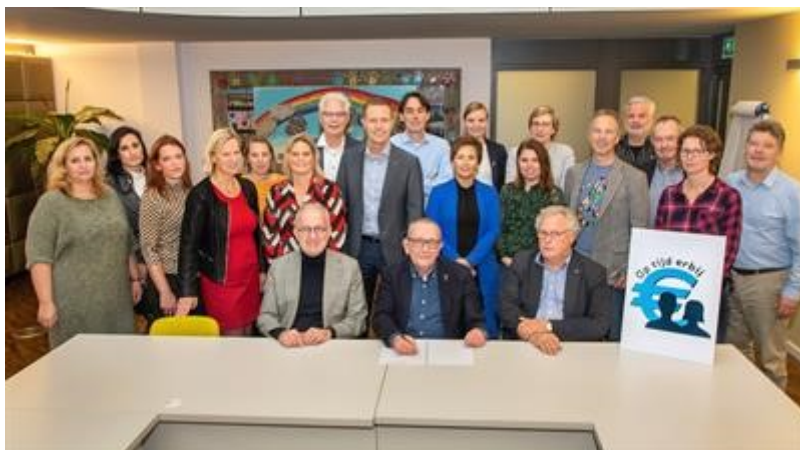
Ondertekening convenant vroegsignalering betaalachterstanden 2019

Tevens is in de nota Armoede en Schuldhulpverlening extra nadruk gelegd op het aangaan van nieuwe samenwerkingsverbanden waarbij het versterken van gezamenlijke initiatieven van publieke- en private partijen een belangrijk onderdeel is. Het betrekken van partijen die tot op heden zelfstandig opereerden of nog geen deel uitmaakten van de keten, biedt kansen voor doorontwikkeling en uiteindelijk het effectiever voorkomen en terugdringen van armoede.