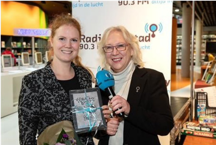
Uitreiking inspiratieprijs Lelystad Doet 2019

activiteiten om het vrijwilligerswerk te ondersteunen en/of te waarderen. Door Welzijn Lelystad wordt eens per kwartaal het Boegbeeldje uitgereikt aan een vrijwilliger of vrijwilligersgroep. Om vrijwilligerswerk toegankelijk en aantrekkelijk te maken heeft de gemeente een verzekering afgesloten voor alle vrijwilligers in de gemeente, zodat zij goed verzekerd zijn.