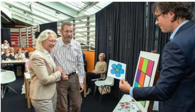
Opening Dementheek 2019

De raad heeft in 2019 een motie aangenomen waarin de raad het college oproept om uit te zoeken wat ervoor nodig is om van Lelystad een dementievriendelijke gemeente te maken. We onderzoeken samen met Alzheimer Nederland wat de voorwaarden zijn voor het predicaat en komen in 2020 met een voorstel.