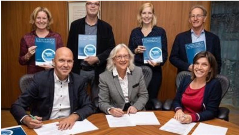
Ondertekening overeenkomsten dagbesteding en ondersteuning thuis 2019

Er wordt jaarlijks bepaald welk budget per aandachtsgroep voor het volgende jaar beschikbaar is. De hoofdaannemers hebben de verantwoordelijkheid en de mogelijkheid om met dit budget maatwerk te leveren. Er is daarmee geen sprake meer van een open eind regeling en er wordt invulling gegeven aan het uitgangspunt dat professionals de ruimte krijgen binnen het budget flexibele ondersteuning te bieden waarbij maatwerk uitgangspunt is.