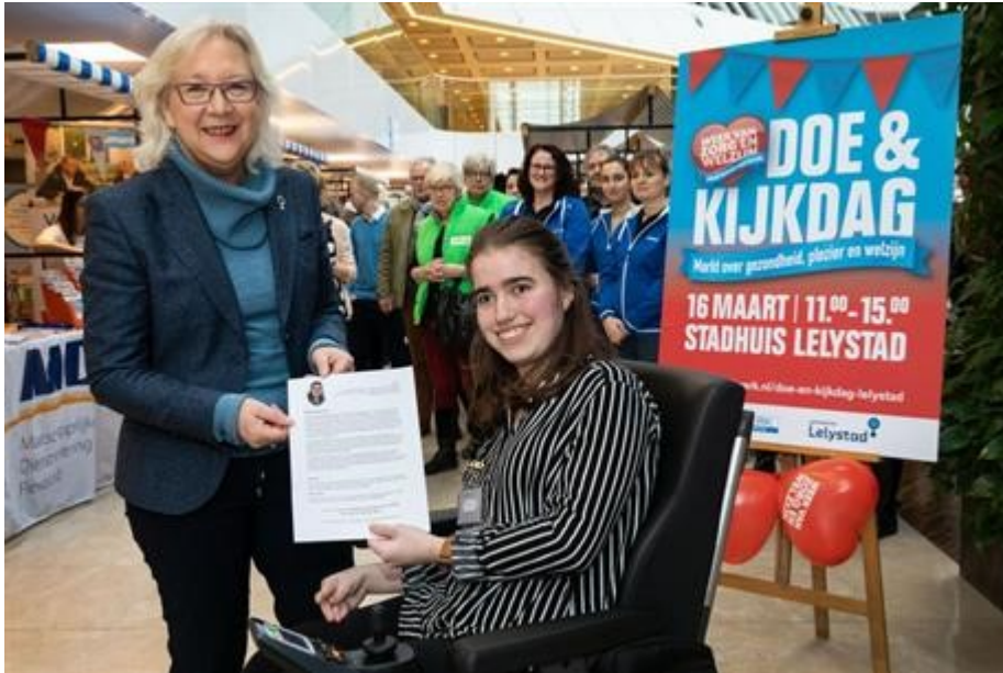
Informatiemarkt Zorg en Welzijn 2019

mensen te interesseren om in de zorg te gaan werken maar vooral ook om inwoners te laten zien wat er allemaal aan welzijn, ondersteuning en zorg in Lelystad is zodat zij dit, als het nodig is, weten te vinden. De editie 2019 is wat dat betreft succesvol verlopen: er was meer interactie en er werd duidelijker naar voren gebracht hoe de wegen in Lelystad lopen, van preventie tot aan echte (medische) zorg. Het resulteerde in meer deelnemende organisaties en een aanzienlijk hoger bezoekersaantal dan bij eerdere edities.