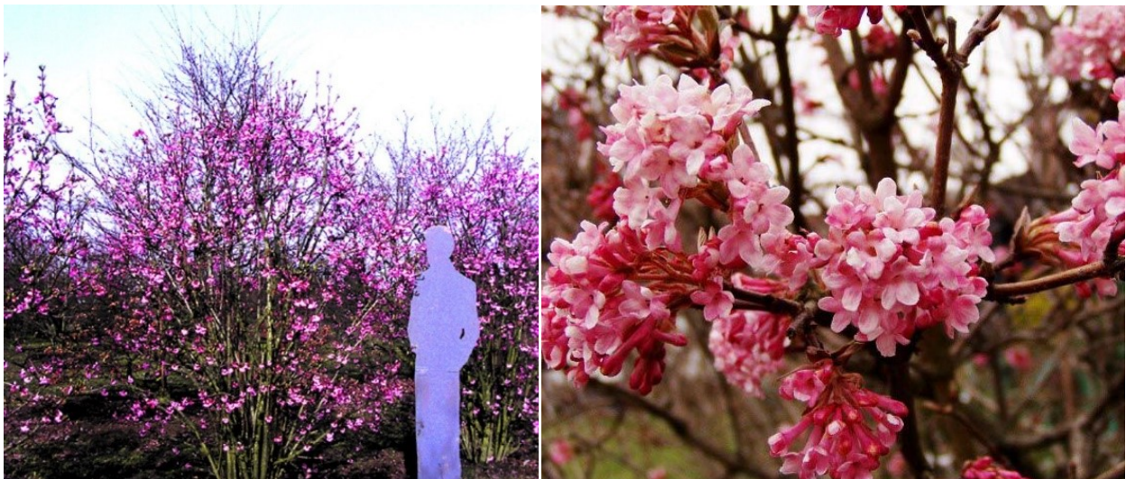
Foto: Viburnum bodnantense 'Dawn'

We kunnen op deze locatie de kabels niet verleggen of groeischermen aanleggen. Daarom hebben wij besloten om op deze locatie een grote, zogenaamde solitaire heester te planten. Zoals de Viburnum bodnantense 'Dawn'. Hoe deze eruit ziet kan u op de afbeelding hieronder zien.