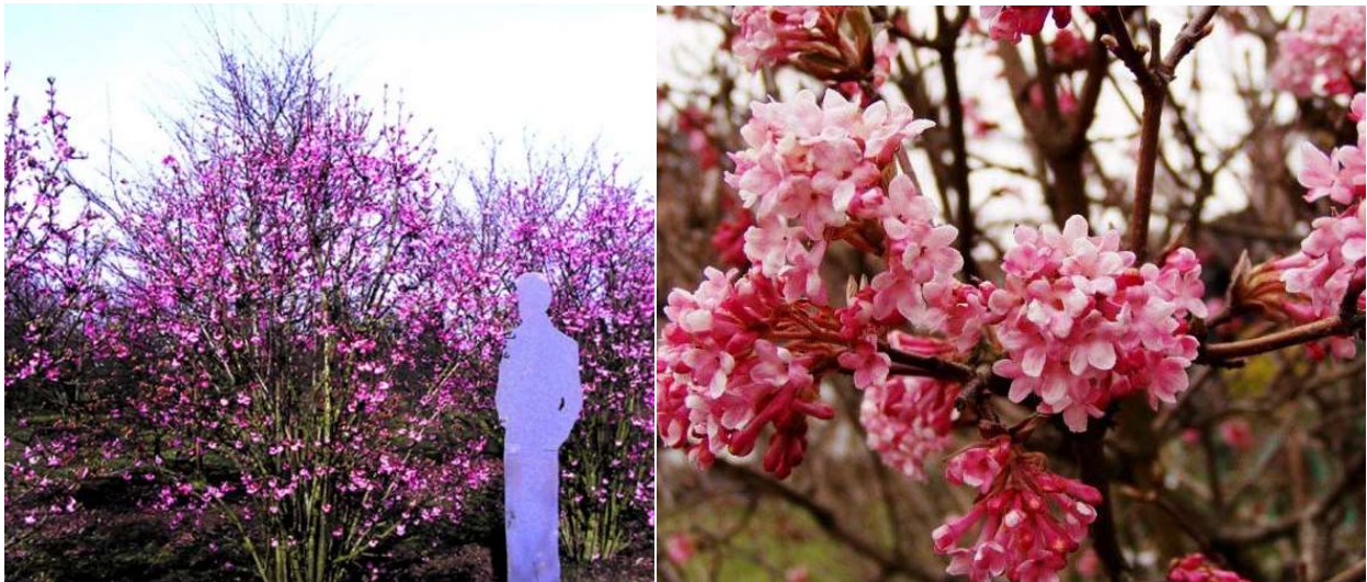
Foto: Viburnum bodnantense 'Dawn'

We kunnen op deze locaties de kabels niet verleggen of groeischermen aanleggen. Daarom hebben wij besloten om op deze locaties grote, zogenaamde solitaire heesters te planten. Zoals de Viburnum bodnantense 'Dawn'. Hoe deze eruit ziet kan u op de afbeelding hieronder zien.