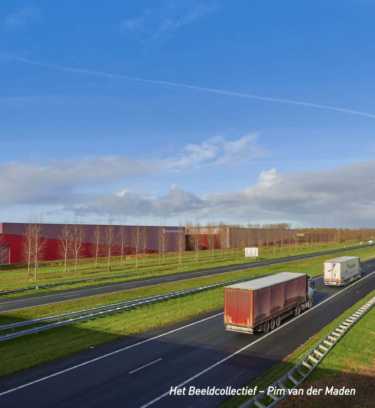
Het Beeldcollectief – Pim van der Maden