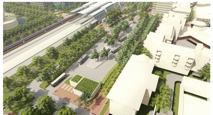
▲ Impressie nieuwe Middendreef

De Middendreef (autoweg) komt dichterbij het spoor. Door de weg te verplaatsen hebben auto's die naar de Zilverparkgarage rijden beter zicht op de fietsers bij het oversteken van het fietspad. Auto's die van de Zilverparkgarage komen, kunnen bij de aansluiting op de Middendreef naar links en rechts rijden. De Zilverparkkade blijft een eenrichtingsweg.