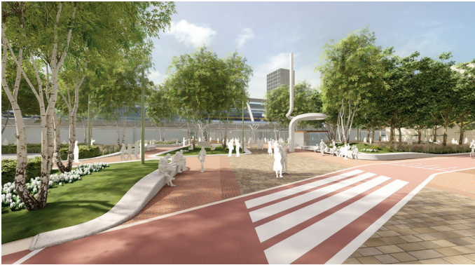
▲ Impressie stationsplein.

Het stationsplein wordt groter en groener. En is bedoeld voor voetgangers. Het moet voor iedereen een fijne verblijfplaats worden. Er komen groenvakken met zitranden. Reizigers kunnen ook op het plein verblijven tot hun bus of trein komt. Er is een duidelijke route naar het eilandbusstation en er zijn geleide- en gidslijnen naar de zuidelijke onderdoorgang, het eilandbusstation en het Stadshart. De (verbouwde) kiosk blijft op het stationsplein staan.