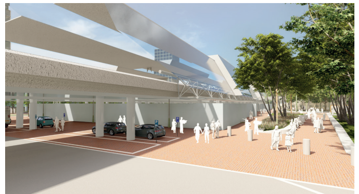
▲ Impressie zuidelijke onderdoorgang.

Er komt een taxistandplaats onder de zuidelijke onderdoorgang. Dat is de onderdoorgang bij de rotonde Visarendreef/Middendreef.