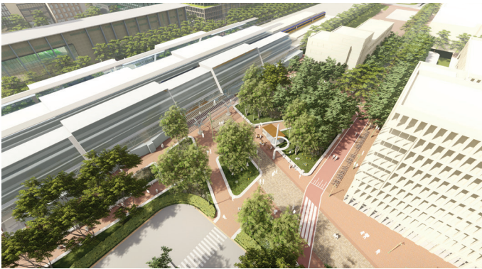
▲ Impressie stationsplein.

Het stationsplein is alleen bedoeld voor voetgangers en fietsers. Er mag dus geen gemotoriseerd verkeer op het Stationsplein en Dukaatplein komen. Er zijn uitzonderingen. Zo kunnen verhuishagens voor het appartementencomplex een ontheffing aanvragen. Hulpdiensten kunnen altijd overal komen.