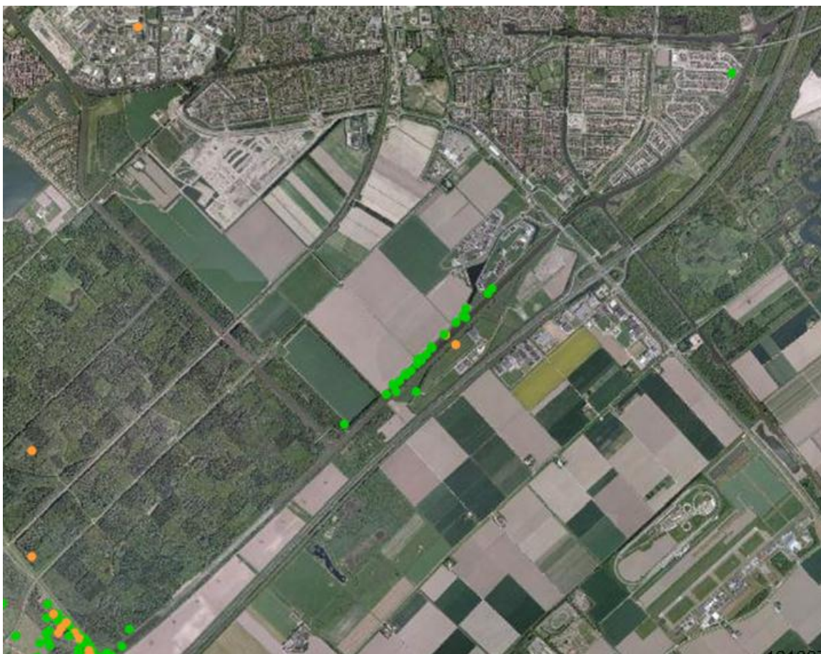
Verspreidingsbeeld van de ringslang periode 2001-2012. Twee clusters zijn nu goed zichtbaar: Oostvaardersveld (Linksonder) en ecozone (midden). Rechtsboven de waarneming uit de Landerijen 2012.

In 2012 is gestart met het monitoren van ringslangen in de ecozone. Gemiddeld zijn in de 6 rondes 3 dieren per ronde gezien. Daarmee evenaart deze route de al jaren bestaande route in Oostvaardersveld. Ook landelijk gezien is een gemiddelde van drie dieren erg goed te noemen.