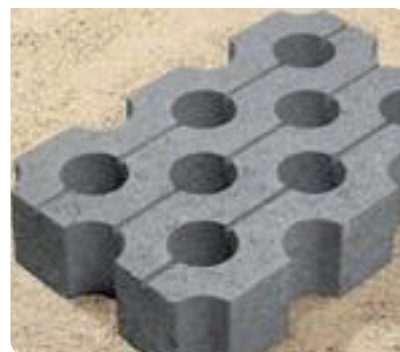
Impressie vlakke grasbetontegel

het winkelcentrum te parkeren. De bewoners van de Eurotower parkeren hun fiets op eigen erf. Het straatmeubilair, zoals prullenbakken en fietsenrekken, wordt hetzelfde voor het hele gebied van het Lelycentre.